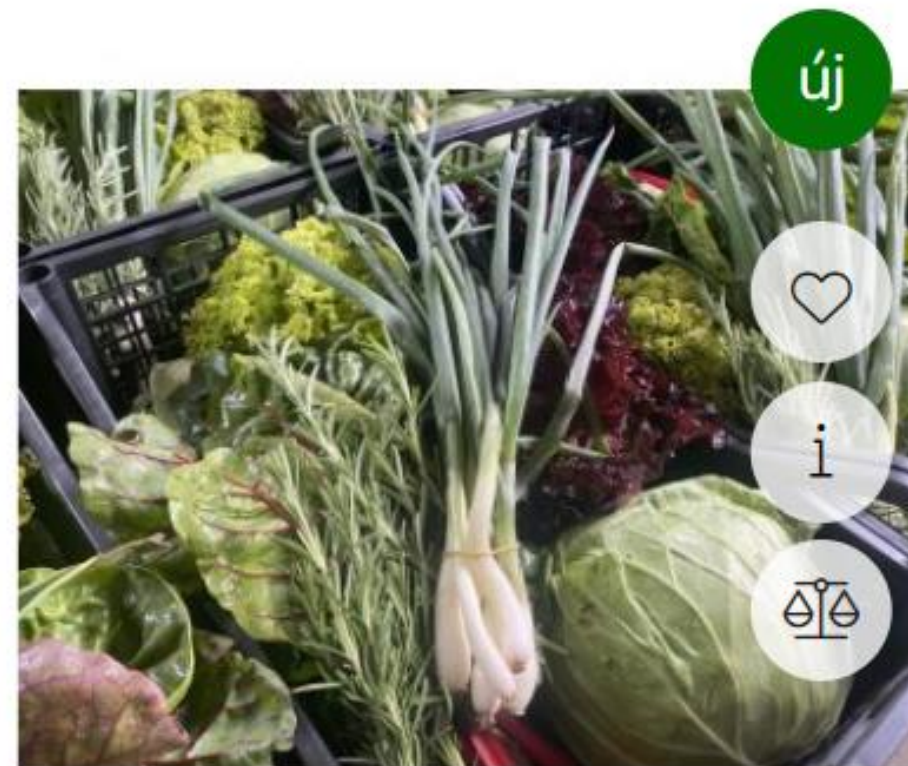
SZEZON KOSÁR 4 KG (20